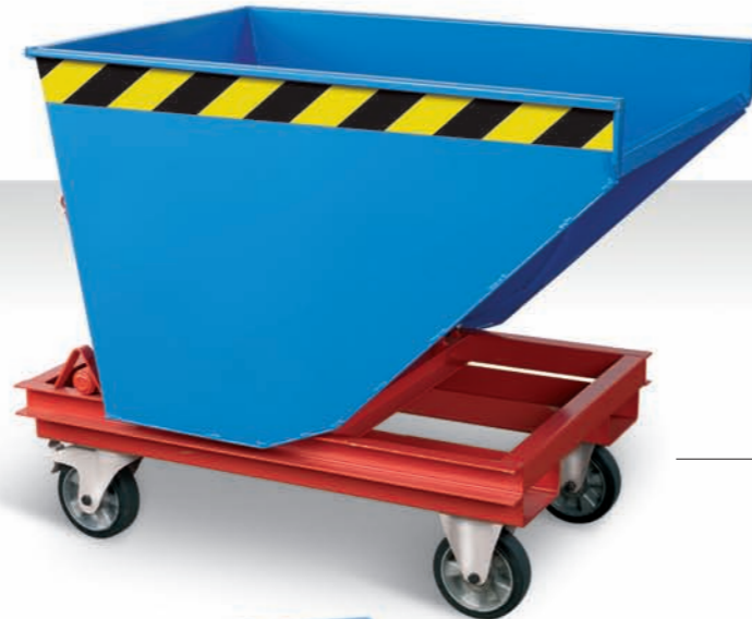
Selbstkipper (Seite 10–13)