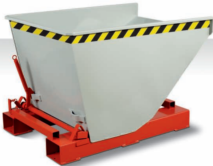
Selbstkipper leicht (Seite 8–9)