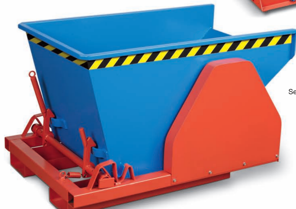
Selbstkipper mit Seitenschutz (Seite 16–17)

Deckel (nachrüstbar) halbaufklappbar mit Handgriff und Arretierung