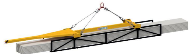
LP mit manueller Kranhubzange