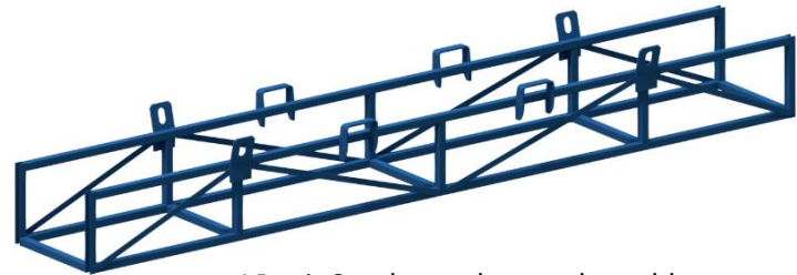
LP mit Staplertaschen und geschlossenen Einhakblechen als Anschläge für ein Seilgehänge