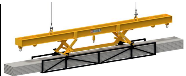
LP mit automatischer Kranhubzange